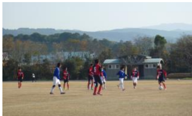
『九州合宿での練習試合』