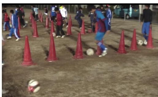
『練習は個人技の向上がメインです』