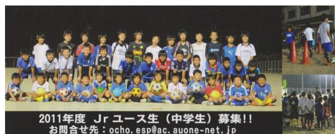
2011年度 Jr ユース生 (中学生) 募集!! お問合せ先: ocho.esp@ac.auone-net.jp