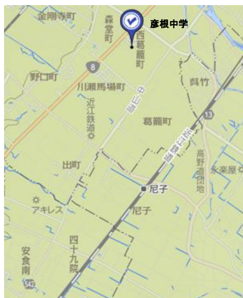
木曜日会場：彦根市立彦根中学校 G & 体育館