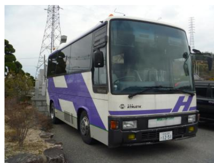
『クラブ所有のバスです』