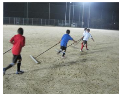
『子どもたちでグラウンド整備』