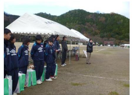
『Jr.ユース生も運営に携わりました』