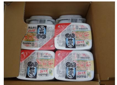
『参加賞のサトウのごはん近江米』

緑 FC(愛知県)、リオペードラ加賀 U-12(石川県)、 大阪市 SS2001Jr.(大阪府)、ディアブロッサ高田 FC U-12(奈良県)