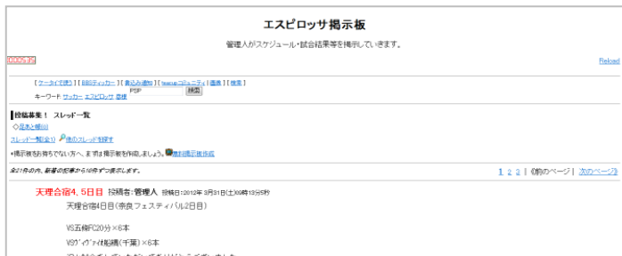
『エスピロッサ掲示板』