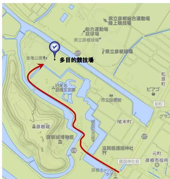
火曜日会場：彦根市金亀公園多目的競技場